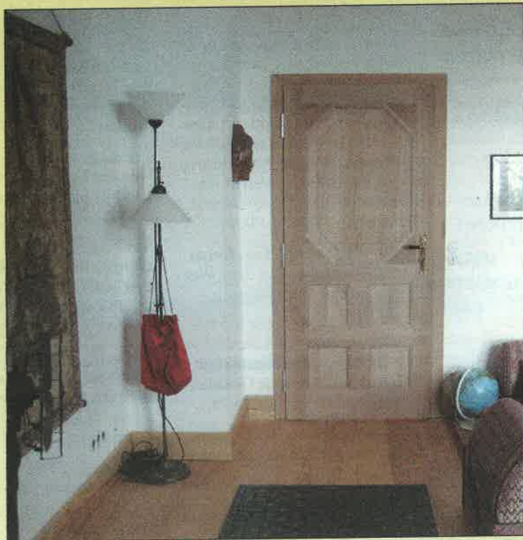
Beim Renovieren auch die Türen nicht vergessen! Auch hier ist geöltes Holz die optimale Lösung für gesundes Wohnen und eine gemütliche Atmosphäre.

wie Latex- oder Kunstharzfarben, Lacken oder Wachs behandelt sein. Gut geeignet sind mineralische Putze, die durch den Zusatz von Marmor sehr edel und dekorativ sein können, ebenso Lehm-, Textil- und Kalkputze. Textilputze ohne Kunststoffzusätze und mit Zellulose als Bindemittel bieten darüber hinaus den Vorteil einer schalldämpfenden Wirkung. Kalkputze haben durch ihren hohen pH-Wert sogar antibakte-